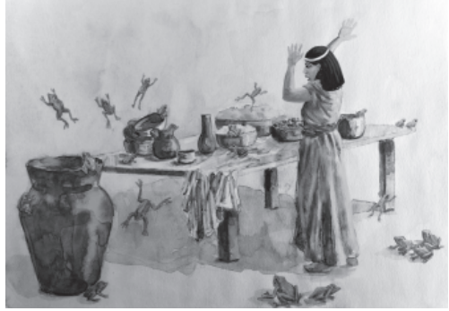
मिस मिं भिकॉनै-भिकॉन

सुणिबेर सब भिकॉनों कै मारि दे, और केवल उं भिकॉनों कै छोड़ौ जो नील गाड़ मिं छी। मैसॉल उं सब मरी भिकॉनों कै जॉम करिबेर उनर थुपुड़ लगौ दे। और उनेरि सड़ैन बाश पुर देश मिं फैल गई।