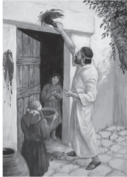
इस्रायली आपण देई मिं खून लगूणई

मी उ रात मिस देशक बीचक बाँट जूल और मिस्रियोंक मैस और जानवर द्विनोक ज्याठ औलादों कैं मारुल। और मी यौ देशोक सब द्याप्तों कैं लै सजा द्यूल, किलैकि मी प्रभु छु। और तुम सब मैस आपण-आपण घरों मिं यौ बोकियक खून लगाया, जो म्यर लिजी निशाण ह्वल कि यौ इस्रायलियोंक घर छु। मी खून लागी घरों कैं छोड़ि द्यूल, और इसिक उ मुशीबत तुमिं नि आओ। यौ दिन तुमर लिजी एक खाश यादगारिक दिन ह्वल और हर साल मिं तुम उ दिन म्यर यादगारिक लिजी यौ त्यार मननै रया।"