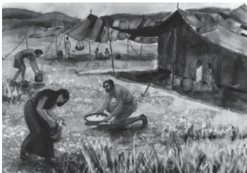
स्वर्ग बे मिलणी खाँण

जब तलक इस्त्रायली कनान देशक वड़ मिं नि पुज, तब तलक उनुल चालीस साल लगातार मन्ना खा।