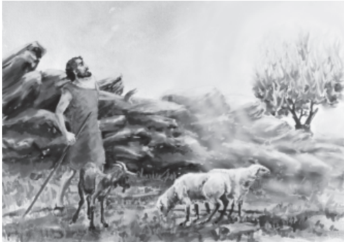
बुज जलुणौ पर भसम नी हुणौय

आँब जा, और इस्रायली मैसोंक पधानों कै जाँम करिबेर उनुधैं कये, "तुमर पुरखोंक परमेश्वरल मिक्कै दर्शन दिबेर कौ, कि मील तुमेरि सुधि ली रॉखी और जो मिस्र देश मिं तुमर दगाड़ करी जाणौ उकै देखि रॉखौ। मी वैद करनु कि तुमुकै मिस्र देश बे निकालिबेर एक यस देश मिं ली जांनु, जां तुमुकै के चीजक कमी नि ह्वेलि।"