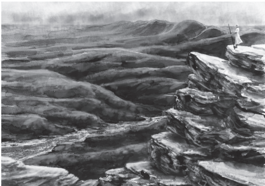
मोशेश दूर बे कनान देस देखणौ

वीक बाद बे आज तलक इस्रायलियों में उ जस और कवे पैद नि हौय, जैक दगाड़ परमेश्वरल आमण-सामण बात करी हो। उकें परमेश्वरल मिस्र देश में रॉजक और सब मिस्रियोंक बीच में आपण चमतकराक कामों कें दिखूणक लिजी भेजौ। और यौ सब चमतकारक काम परमेश्वरल इस्रायलियोंक दगाड़ मोशेशक जरियल करीं।